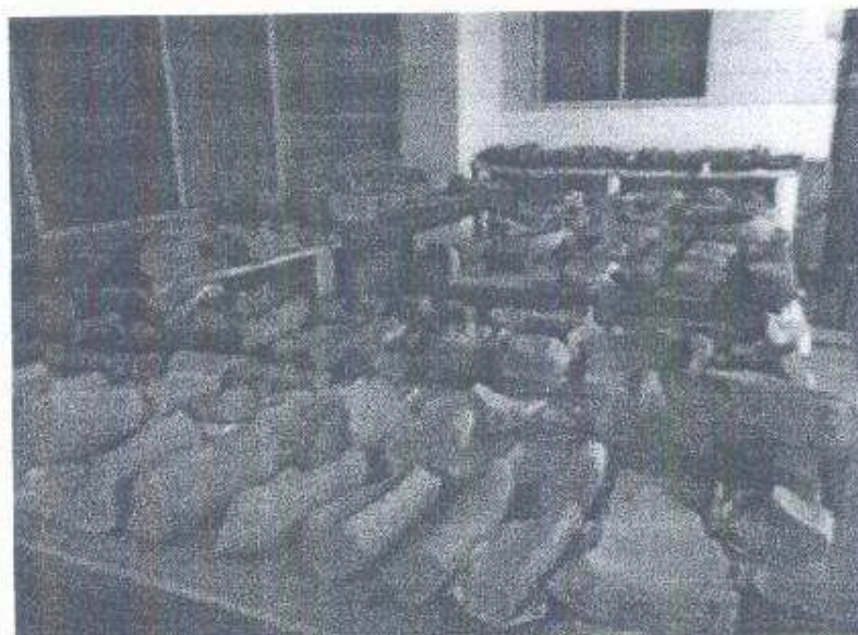
Foto 1: Parte de la colección de metates documentados en Tak'alik Ab'aj (Flores 2013)

También quedó programado en el POA el área establecida en la cual se realizaran los trabajos de exploración arqueológica durante el año 2014.